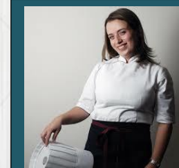
FIGRELA FALCO PERU 2016