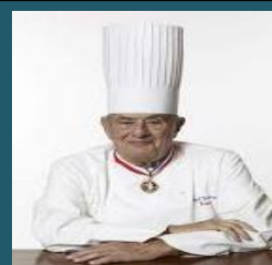
PAUL BOCOUSE FRANCIA 2010